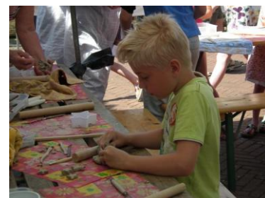
Kinderworkshop bij het Keramiekplein 26 mei 2012.

Een unieke dag, op een unieke locatie en zeker voor herhaling vatbaar.